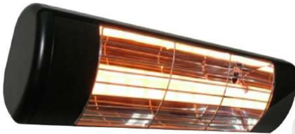
Ref. 585025 y 585026

Ideales para terrazas, jardines y para colocar en sombrillas y toldos gracias a su soporte (incluido en el suministro)