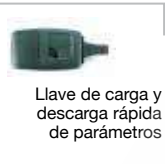
Llave de carga y descarga rápida de parámetros